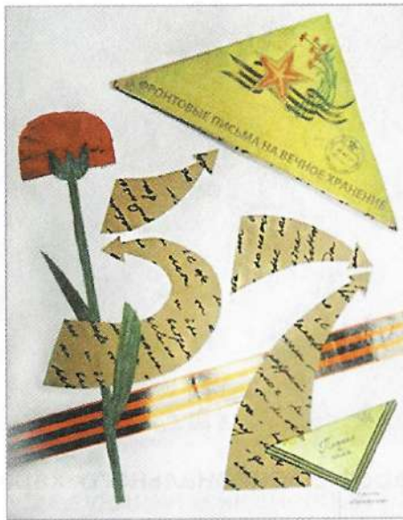
Письма военных лет: особая форма – треугольник; содержание писем; работа военно-полевой почтовой службы